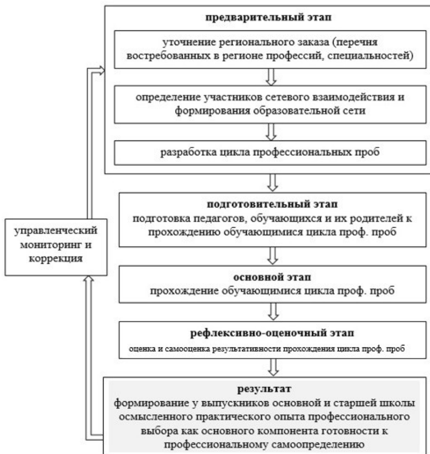
Рис. 2. Алгоритм организации цикла профессиональных проб

4. Каждая проба реализуется в условиях профессионального контекста, приближенных к реальной профессиональной деятельности по данной профессии, специальности – как правило, за пределами школы (в специально оборудованных мастерских, лабораториях, производственных участках или др., в профессиональных образовательных организациях, вузах либо на территории учебных подразделений предприятий-работодателей).