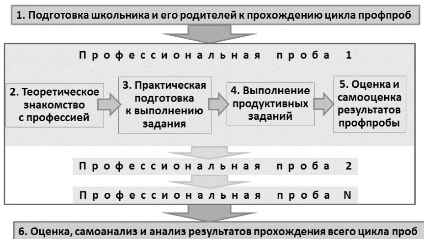
Рис. 3. Внутренняя структура цикла профессиональных проб

Этапы со второго по пятый относятся к каждой конкретной профессиональной пробе и повторяются столько раз, сколько профессиональных проб проходит школьник. Все они реализуются в процессе сетевого взаимодействия всех институциональных субъектов, каждый из которых обладает своей компетенцией и несёт свою долю ответственности. Первый и шестой этапы относятся ко всему циклу профессиональных проб и осуществляются один раз; как правило, за их организацию, содержание и результативность полную ответственность несёт школа.